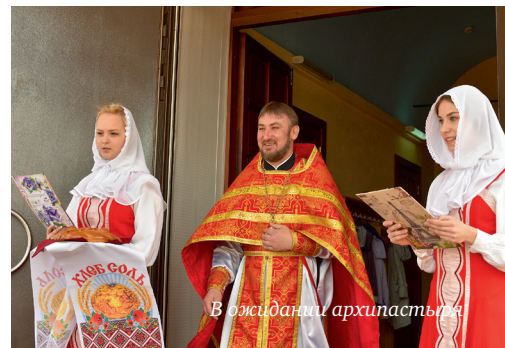
В ожидании архипастыря