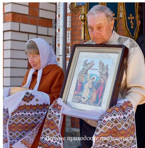
Верные приходские помощники