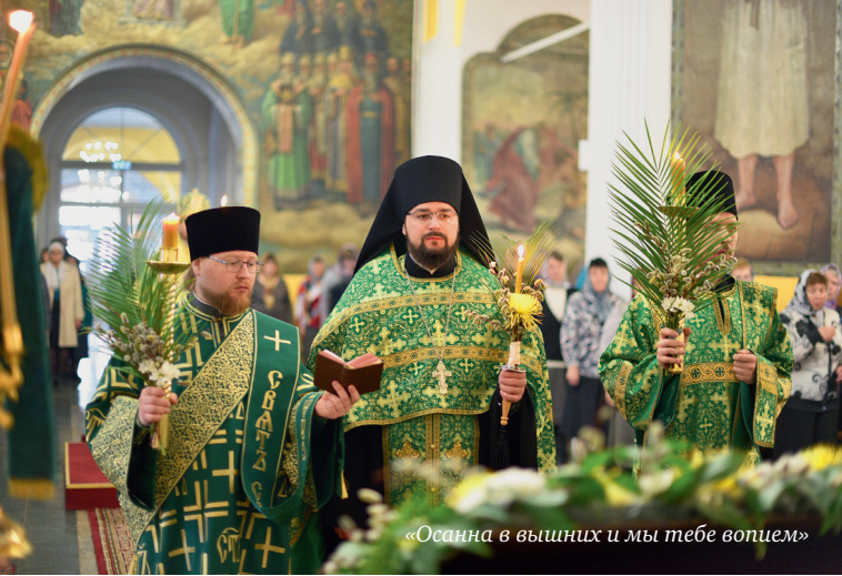
«Осанна в вышних и мы тебе вопшем»