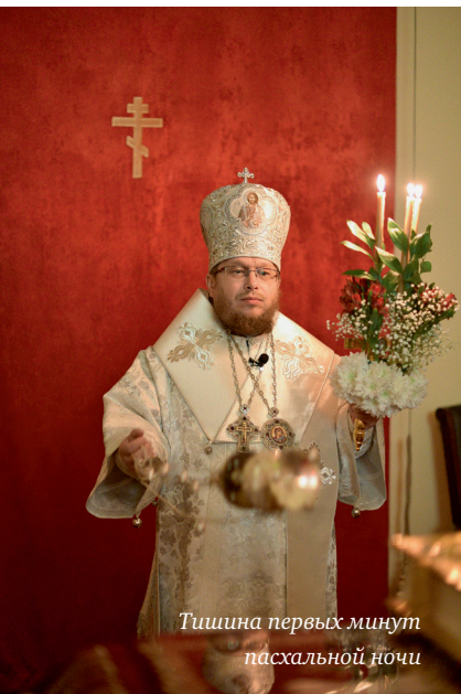
Тишина первых минут пасхальной ночи