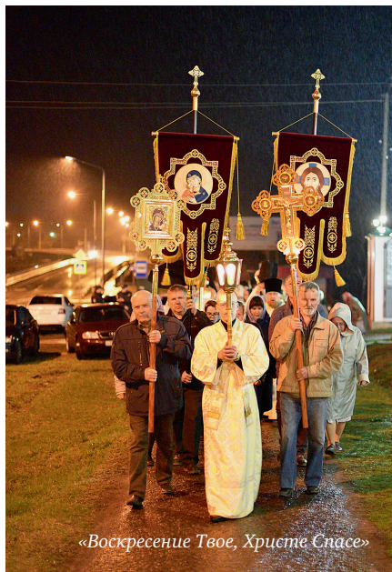
«Воскресение Твое, Христе Спасе»