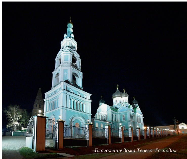
«Благолеие дома Твоего, Господи»