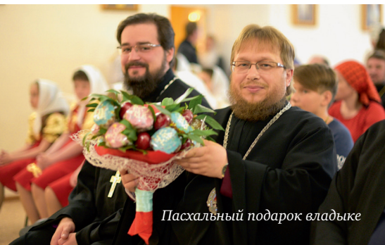
Пасхальный подарок владыке